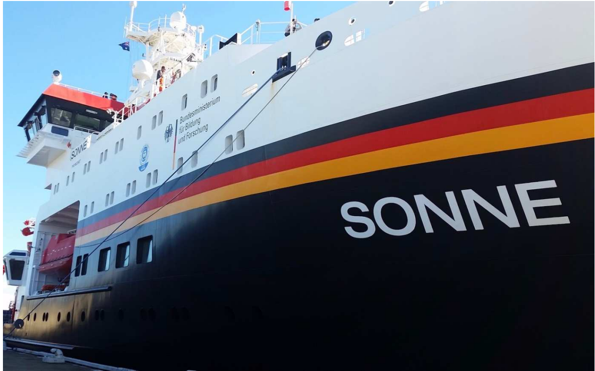
Das deutsche FS Sonne II im Hafen von Fremantle, Westaustralien

Presse- und Öffentlichkeitsarbeit anlässlich des Besuchs des FS Sonne II in Fremantle am 05.06.2017